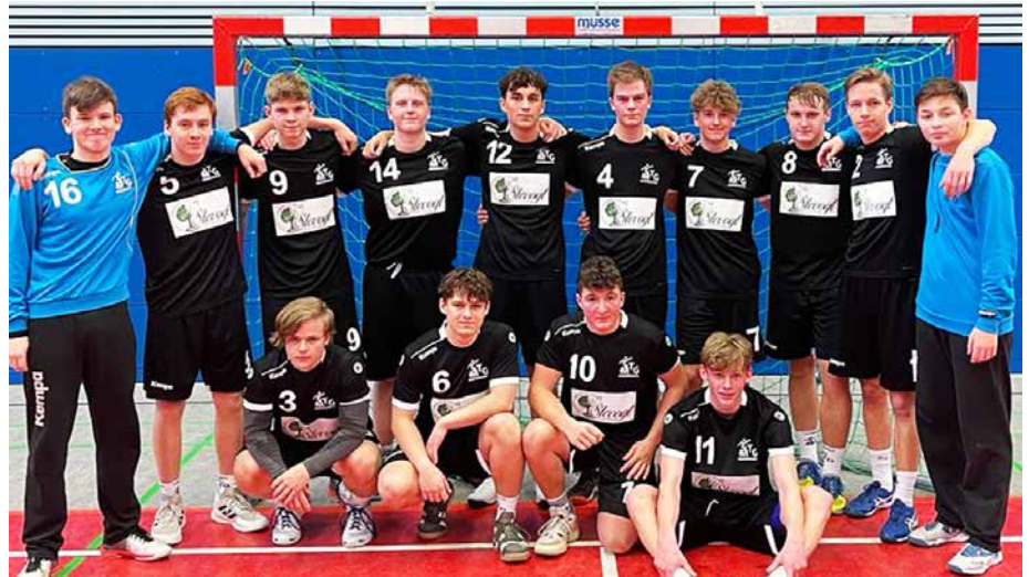
A-Jugend mit den neuen Trikots des Sponsors Garten- und Landschaftsbau Slevogt