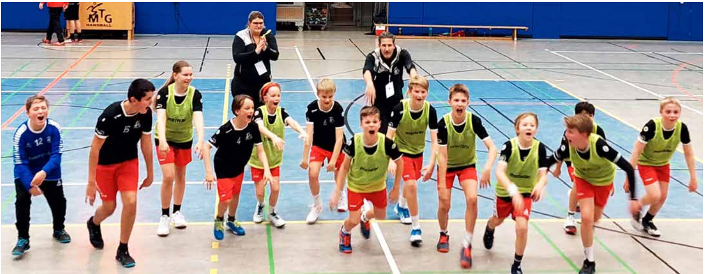
Jubelnde D-Jugend nach dem 27:26-Sieg gegen TuSEM Essen

platz vorgearbeitet. Es wäre aber durchaus auch der eine oder andere Punkt mehr drin gewesen. Aber dennoch zeigen die Jungs eine gute Entwicklung.