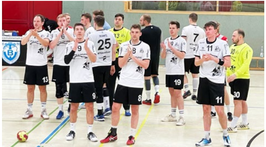
Verabschiedung in Wülfrath

Die zweite Mannschaft stand bis zu ihrem letzten Saisonspiel in der Bezirksliga mit einer Niederlage auf Rang zwei sehr gut da, wird aber aufgrund der Ausfälle wahrscheinlich mit dem Landesligaaufstieg