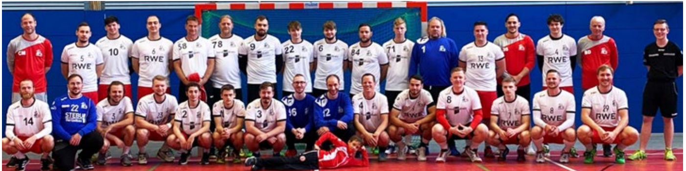
MTG II und MTG III

Nach zwei coronabedingt abgebrochenen Spielzeiten läuft die Saison 2021/22 im Handballverband Niederrhein und im Handballkreis Essen bislang (fast) wieder wie in Vor-Corona-Zeiten. Natürlich sind die Coronaregeln zu beachten, was für die Zuschauer einen Zugang in den meisten Hallen nach der 3G-Regel bedeutet und das Tragen einer Maske in einigen Hallenbereichen, aber es fühlt sich schon wieder an wie früher!