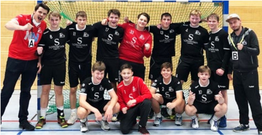
Aufstieg in die Oberliga: B-Jugend 2021/22