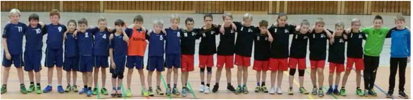
Unsere E-Jugend vor ihrem Meisterschaftsspiel