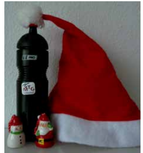
Geschenke für die Jugend

31 Spieler, Spielerinnen und Trainer/innen waren pünktlich um 18 Uhr in der